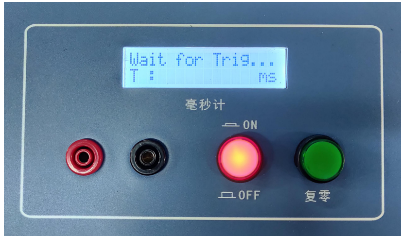
图 1:毫秒计上电后等待触发的状态