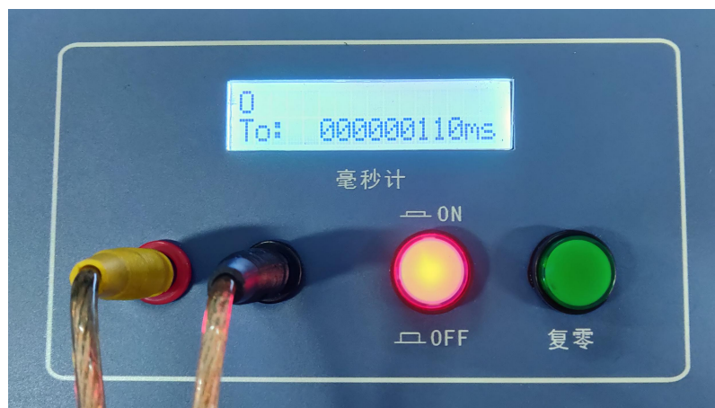
图 3:毫秒计分触发的结果显示