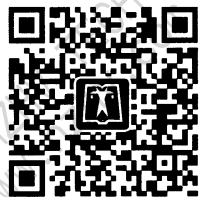
中国电力出版社官方微信