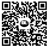
电力标准信息微信