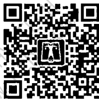
中国电力出版社官方微信