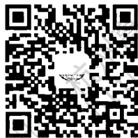
电力标准信息微信